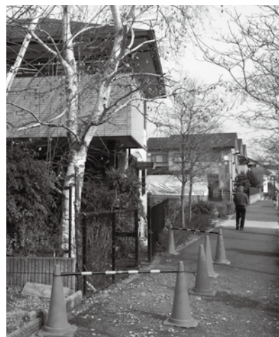
▲写真1 カラーコーンとバーを使用して、通行人が作業範囲に入らない工夫をしている。

「シラカバは気候的に東京で育てるには難しい樹種です。こちらのお客様は、以前2回シラカバを植栽されたそうですが、やはり根付かずに枯れてしまったそうです。難しい木ですが、お客様にとっては大切な木です。したがって、剪定期も適期を選び、剪定方法もベランダに接する部分と、敷地外に出た部分以外は、あまり手を入れずに自然な樹形を残すようにしました」