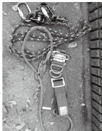
▶写真2 ヘルメット、安全帯はもちろん、そのほかに登山用のハーネスも使用。