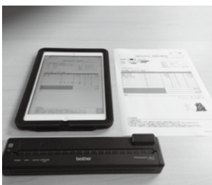
写真2 写真手前がモバイルプリンター。現場で見積書を出し、その場で提出できる。お客様からの作業完了確認サインは、電子サインを採用。

クイック・ガーデニングでは、2014年6月よりiPadと感熱紙モバイルプリンターを使用した新しい見積もりシステムを導入しました(写真2)。それ以前は、