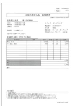
資料2 見積書サンプル。

積書を提出します(資料2)。高さを把握していれば、ホームページなどを見ながら自分でも見積もりすることができるので、安心です(資料3)。