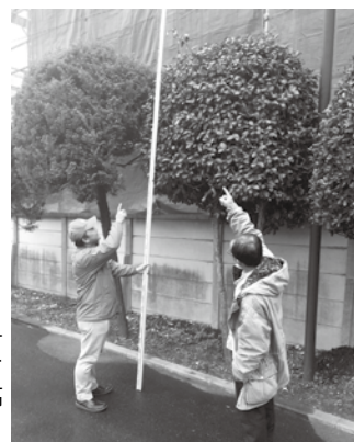
写真1 木の高さはスタッフ(計測器)を使って、お客様に明示する。写真の樹木は4メートルの高さなので、剪定料金は6,500円。